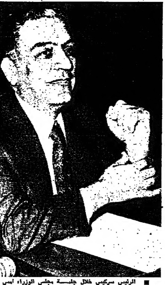
الرئيس سركيس خلال جلسة مجلس الوزراء امس

صدر عن المديرية العامة لقوى الامن الداخلي - مكتب العلاقات العامة - البلاغ التالي: ١٧٧٧-٣-٦ الساعة الحادية عشرة وفي بيروت اقيم مجهول على وضع كبة من الهنالكات ضمن صندوق خشبي بعد الفلانة امام باب شرقية في الطابق الرابعة من احدى البنايات في شارع السادات، وقد اعد عنكبوت حارس المبنى وتم تعطيلها. وبذات التاريخ الساعة ١٩ اتصل بمخبر بعيدا احد المواطنين فنادى من وجود جسم غريب في قناة جلي طريق بعيدا امام باب شرقية فتم قطع سكة الحديد ٢ كيلوغراما، وتم تعطيلها قبل التفجير الحد لانفجارها يربح ساعة. ان قيادة قوى الامن الداخلي تطلب الى جميع المواطنين وكل منهم خبر على ان لبنان - افادة لغرب مخبر او غرة طيات تابعة لقوى الامن الداخلي والقوات الذراع العربية وذلك باسرع ما يمكن لدى مشاهدتهم مواد مشبوهة او اشياء تدعو للريبة. وورد في تقارير قوى الامن الداخلي: - مكتب العلاقات العامة ما يلي: في الساعة ١٠ و ٥٥ دقيقة من تاريخ اليوم - ايام - واتناء طهيجران زراعي في محل حداثة في المختارة حصل انفجار ادى الى مقتل صاحب الجرار واحد العمال واصابة اربعة اخرين بجراح. بوشر التحقيق واستدعي الضحايا - البقية على الصفحة ١.